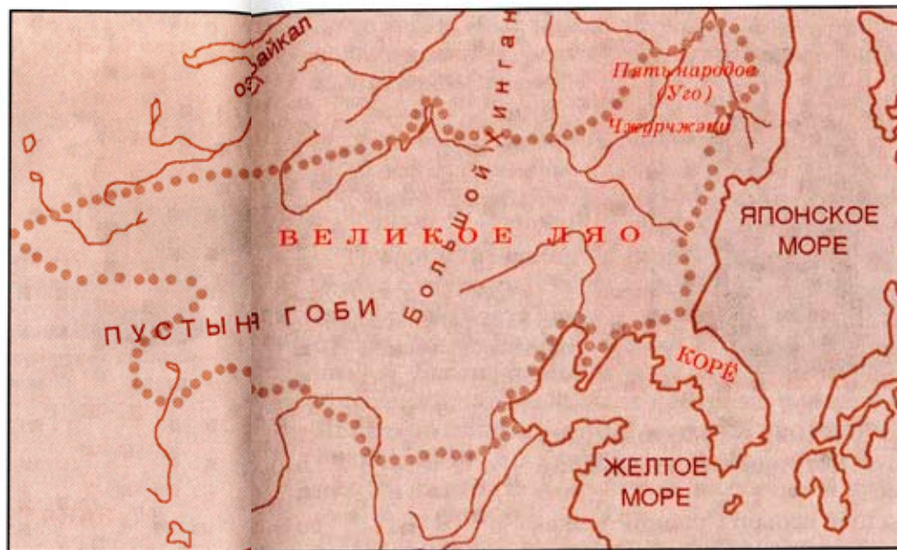
Рис. 32. Империя Ляо (XII век)

? * Какую причину падения Бохая ты считаешь решающей? (Вернись к этому вопросу, дочитав параграф до конца.)