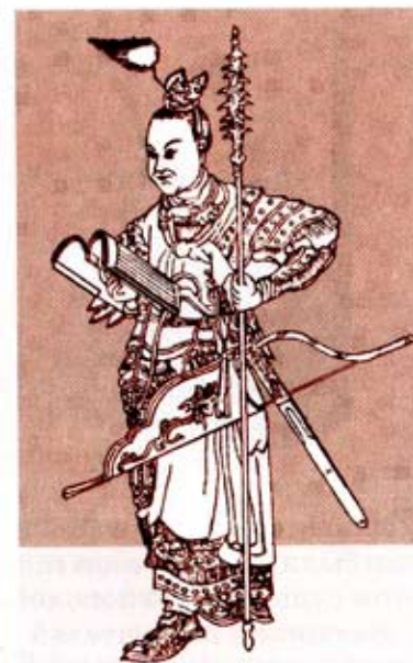
Рис. 33. Правитель империи Ляо

3. От Бохая до Цзинь. Бохайское царство перестало существовать в 926 году. Однако кидани смогли захватить только западные и юго-западные его земли. На них было создано вассальное государство Восточная Дань . Во главе его Абаоцзи поставил своего старшего сына. На остальной территории Бохая сопротивление не ослабевало. Это заставило киданей отказаться от дальнейших военных действий. Определенную роль в этом сыграла и смерть Елюя Абаоцзи. Его наследник — младший сын Дэгуан — главной своей целью видел завоевание Китая. Война с Поднебесной продолжалась до середины X века. Несмотря на упорное сопротивление, Северный Китай был захвачен. Эту территорию Дэгуан объявил вассальным государством и провозгласил себя императором.