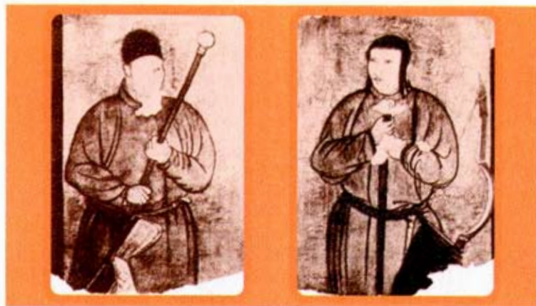
Рис. 34. Фрагменты фресок с изображением киданей

мощные из них произошли в 975 и 1029—1030 годах. Все они были жестоко подавлены, но могущество киданей при этом существенно поколебалось.